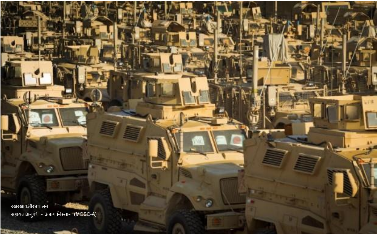
रखरखाव और प्रचालन सहायता अनुबंध - अफगानिस्तान (MOSC-A)