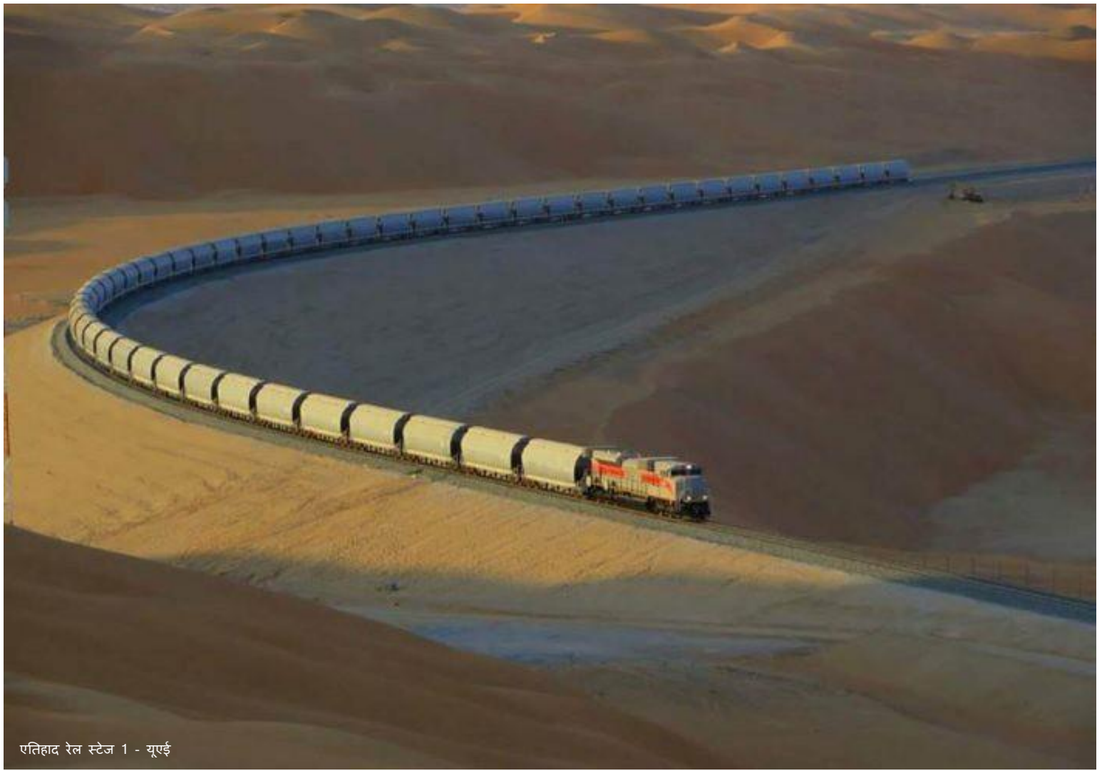
एतिहाद रेल स्टेज 1 - यूएई