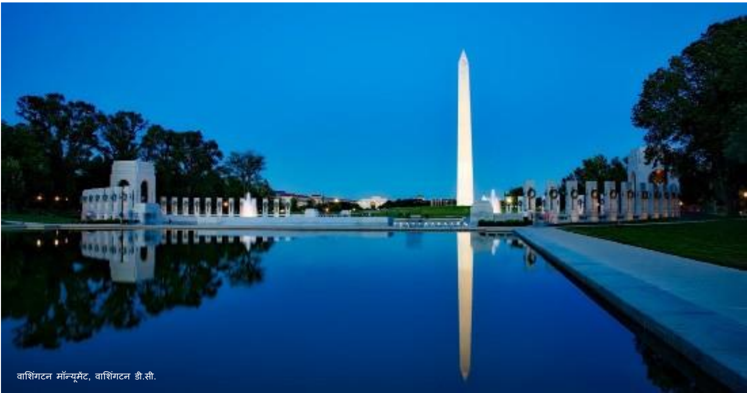
वाशिंगटन मॉन्यूमेंट, वाशिंगटन डी.सी.