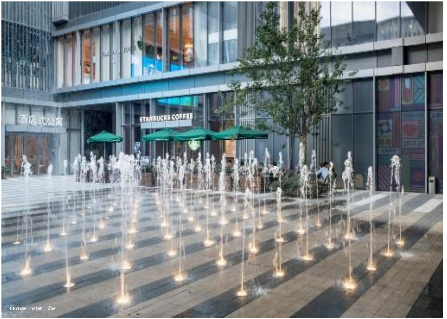
किंगचून प्लाजा, चीन