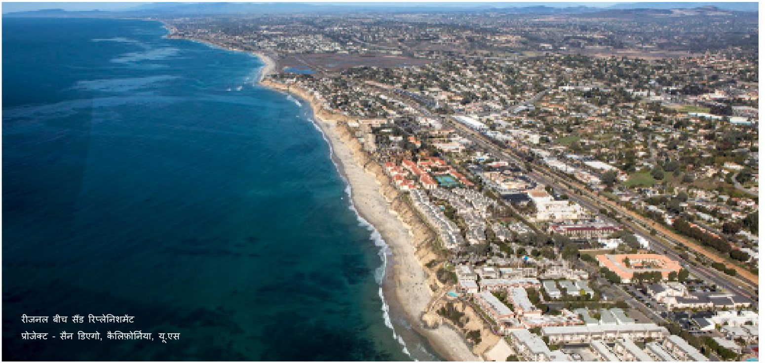
रीजनल बीच सैंड रिप्लेनिशमेंट प्रोजेक्ट - सैन डिएगो, कैलिफोर्निया, यूएस