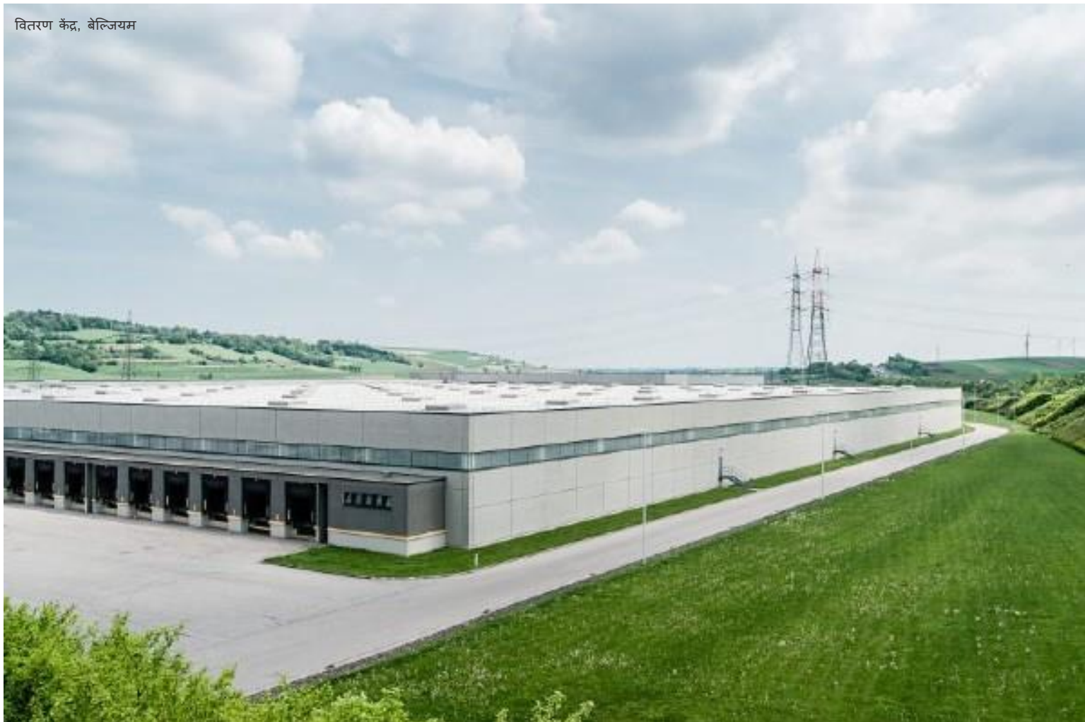
वितरण केंद्र, बेल्जियम

और उन्हें मार्गदर्शन और/या कानूनी विभाग से परामर्श करने के लिए इकोसिस्टम पर इ्यू डिलिजेंस पृष्ठ पर जाने के लिए प्रोत्साहित किया जाता है।