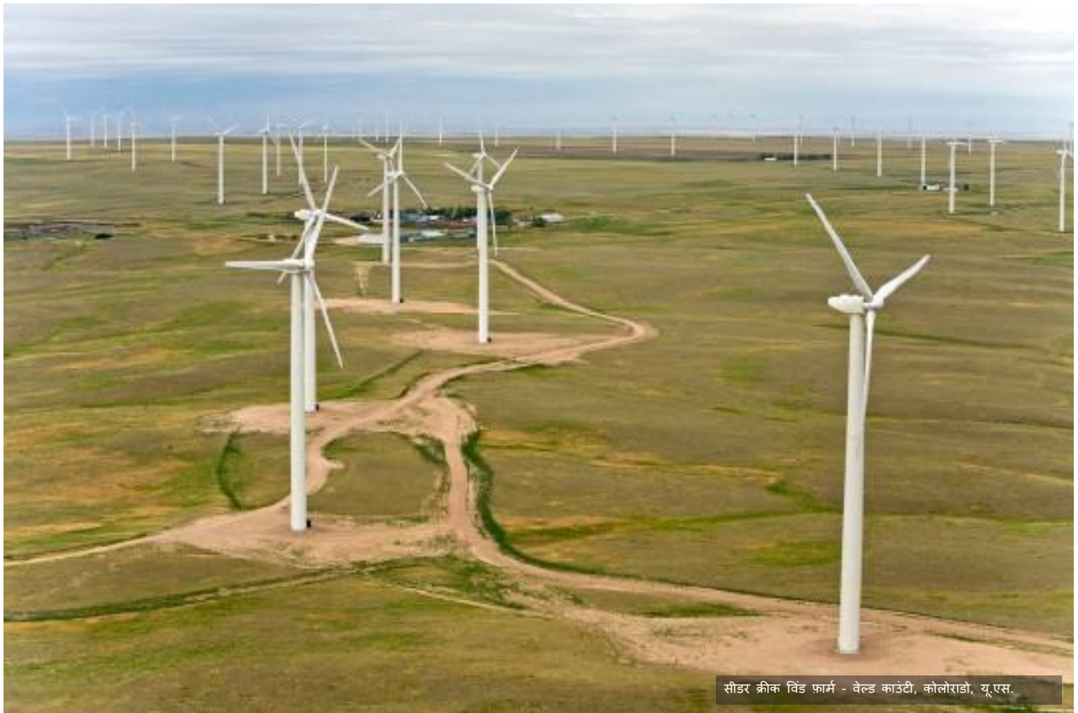
सीडर क्रीक विंड फार्म - वेल्ड काउंटी, कोलोराडो, यू.एस.

एक IFI प्रोजेक्ट के साथ जुड़ते समय, सभी प्रमुख कर्मचारी प्रस्ताव जमा करने से पहले प्रोजेक्ट पर काम करने के लिए औपचारिक रूप से सहमत होंगे और IFI वित्त पोषित व्यवसाय प्रबंधन नीति के अनुसार IFI प्रोजेक्ट के अनुरूप अपने प्रशिक्षण को पूरा करेंगे। ग्लोबल IFI लीड को किसी भी संभावित मुख्य कार्मिक परिवर्तन की सूचना दी जाएगी।