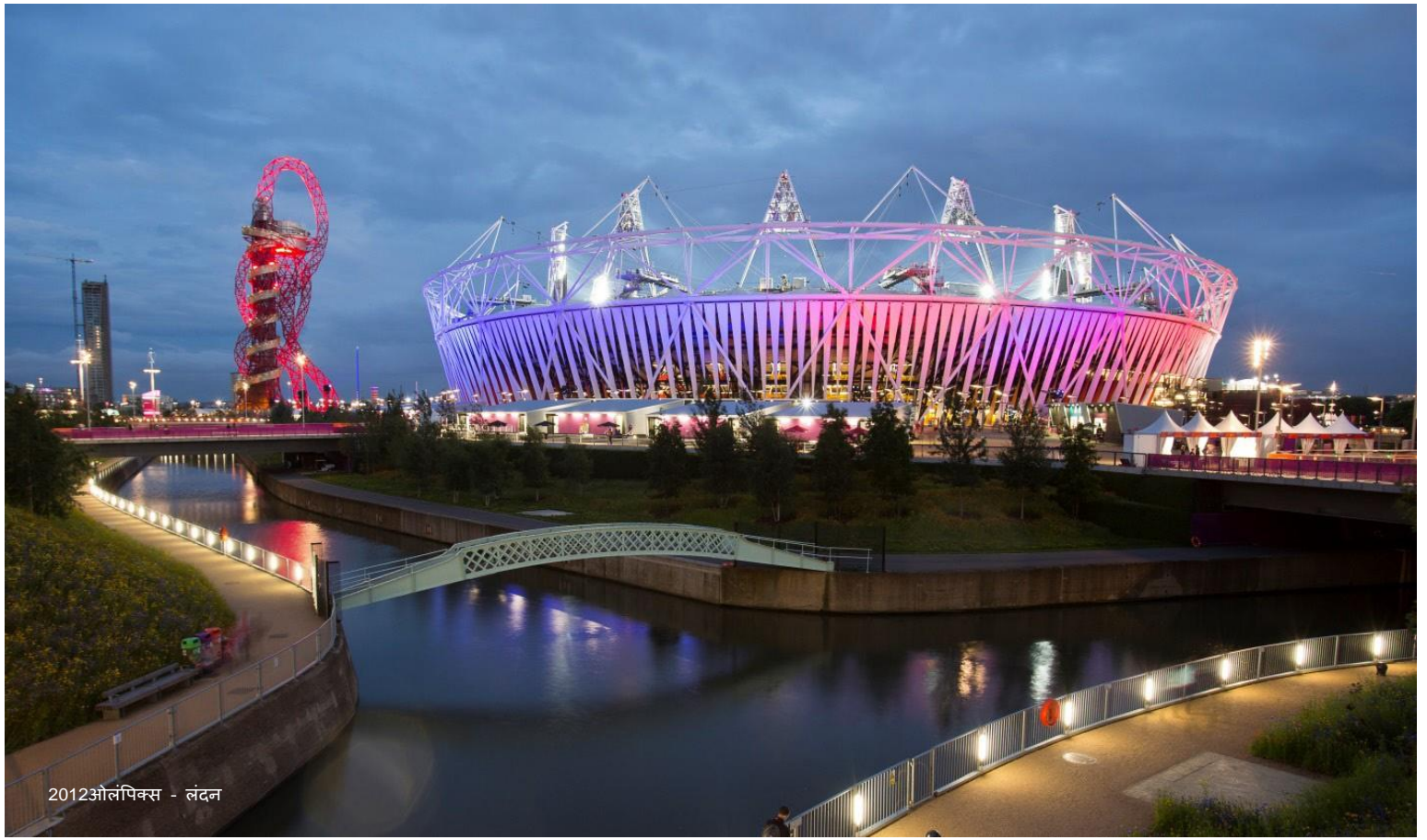
2012ओलंपिक्स - लंदन