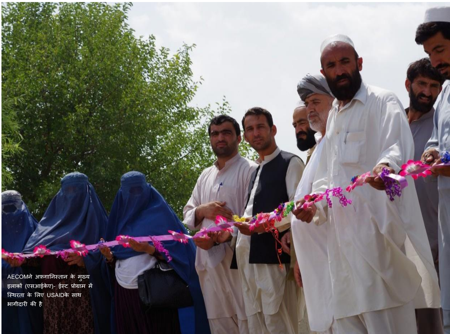
AECOM ने अफगानिस्तान के मुख्य इलाकों (एसआईकेए)- ईस्ट प्रोग्राम में स्थिरता के लिए USAID के साथ भागीदारी की है।

इस निषेध का एकमात्र अपवाद यह है कि इसमें शारीरिक क्षति का एक स्पष्ट और वर्तमान खतरा है और कर्मचारी को ऐसे किसी त्वरित नुकसान से बचाने के लिए सुविधा भुगतान करना आवश्यक है। ऐसे उदाहरणों में जहां सुविधा भुगतान करने से पहले इन-हाउस काउंसिल के साथ परामर्श संभव नहीं है, ऐसे किसी भी भुगतान की सूचना तुरंत कानूनी विभाग को दी जानी चाहिए।